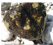
Biofilm à cyanobactéries