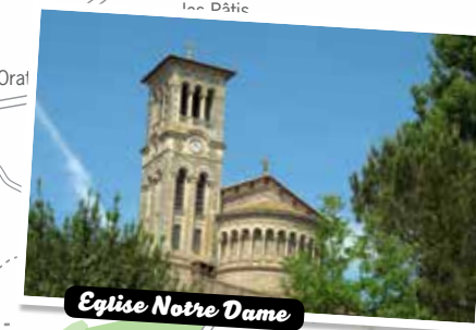
Eglise Notre Dame

Le GR® de Pays de Sèvre et Maine est une œuvre originale, déposée par la Fédération Française de la Randonnée Pédestre. Autorisation de reproduction 2016