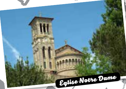
Église Notre Dame