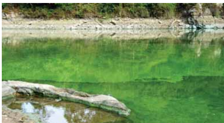
Plan d'eau contaminé par des cyanobactéries

Si l'un des symptômes suivants se manifeste, il est impératif que vous consultiez votre médecin en lui précisant que vous avez pratiqué une activité nautique en eau douce potentiellement polluée : maux de tête, fièvre, vomissements, diarrhée, douleurs abdominales, otite, conjonctivite et/ou douleurs urinaires. Suite au diagnostic du médecin, pensez à avertir votre base nautique .