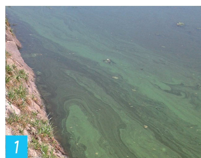
1/Planctoniques « fleurs d'eau » Écume de couleur bleu-vert à la surface de l'eau

Pas de tige ni de feuille, ce ne sont pas des plantes. À ne pas confondre avec des lentilles d'eau ! Microscopiques, elles sont surtout visibles quand elles prolifèrent de manière excessive !