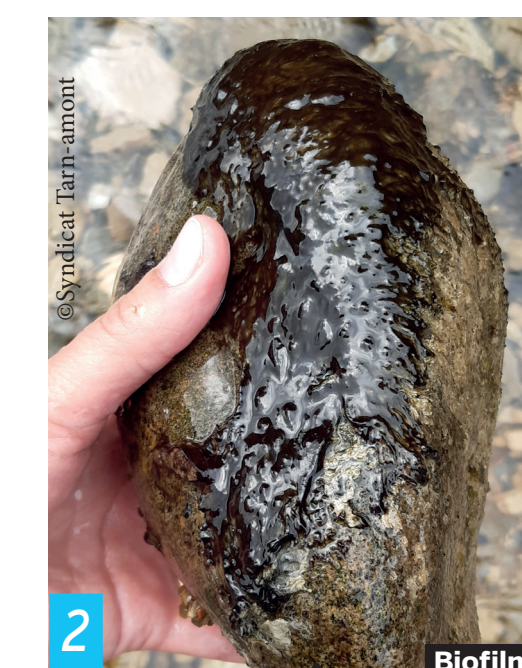
2/Benthiques « flocs, biofilms »

Tapis sur le lit des ruisseaux ou rivières ( biofilm vert foncé à noir), sur galets, pierres ou végétations, leur détachement créé des « flocs » en suspension à la surface (aspect spongieux).